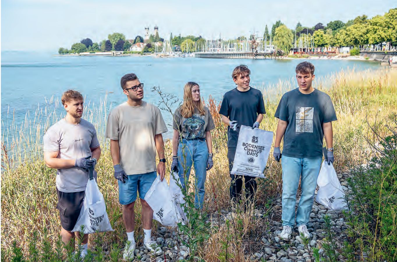
Energie-Scouts in Aktion: Erst tatkräftig helfen ... und danach das Wissen vertiefen und systematisieren. Ein prima Mix aus Theorie und Praxis.