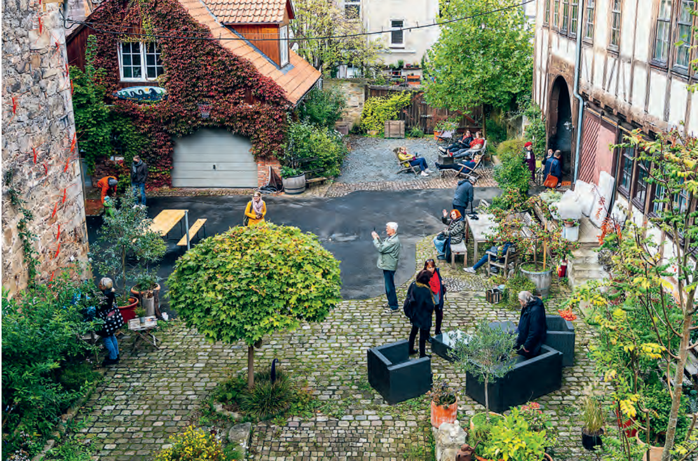
Malerische Innenhöfe, charismatische Innenräume: Es gibt viel zu entdecken in der historischen Altstadt.