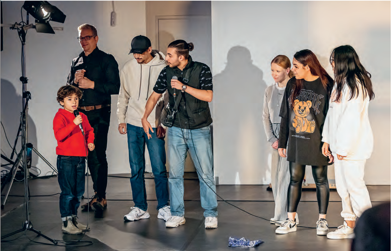
Rappen, sprayen, sich selbst ausprobieren: Vieles ist möglich im Kinder-Jugend-Kulturhaus mitten in Münster. Es wirkt bunt, wild, chaotisch, folgt aber einem klaren Plan: Kreativität möglich machen.